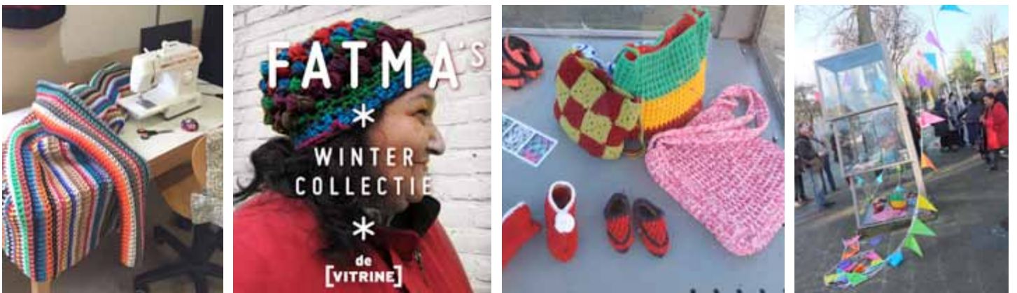
collectie accessoires. Deze en andere projecten hebben we tentoongesteld in De Vitrine die wij in ons beheer hebben.