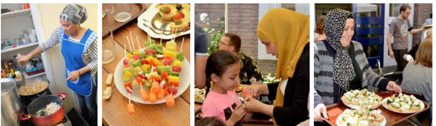
Verse ingrediënten, voorlichting en actief bezig zijn in de keuken vormden de basis voor de workshops Gezonde voeding .