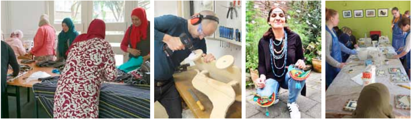
Buurtbewoners nemen graag deel aan ons aanbod creatieve workshops : naailes, houtbewerking, sieraden maken en mozaïek.