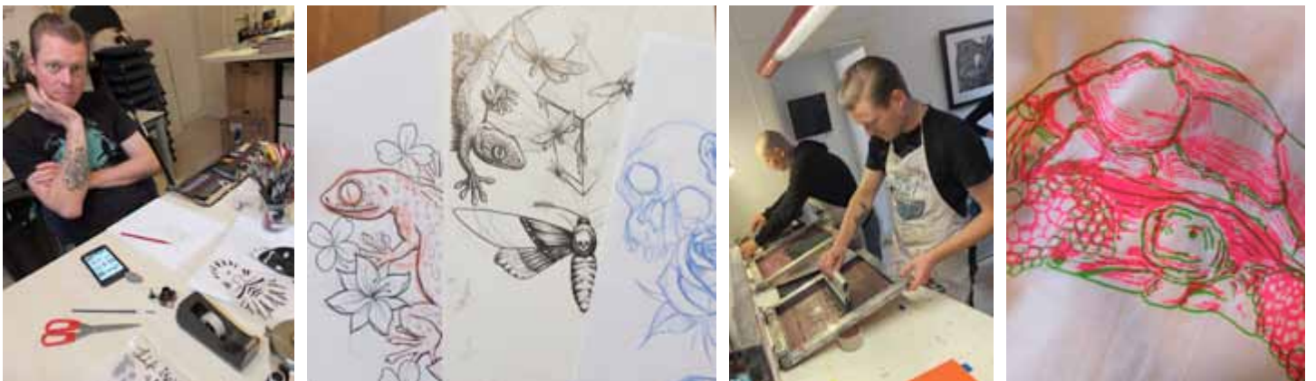
In het kader van Citylab010 hebben we diverse creatieve projecten geïnitieerd, waaronder: een T-shirtlijn en een gehaakte