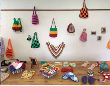
Gehaakte tassen en accessoires