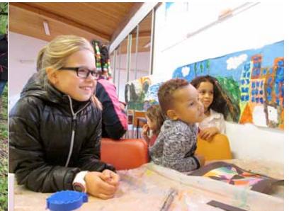
Kinderworkshop Speeltuyn Millinx

Voor het komende programmajaar hebben wij drie verschillende workshops gepland: