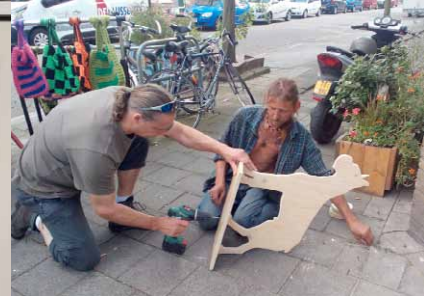
Producten in oplage