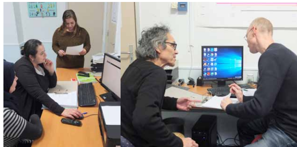
Hulp met formulieren en administratieve zaken

Om de lijnen met andere (hulp-)organisaties zo kort mogelijk te houden zijn wij constant bezig om ons netwerk te verstevigen en samenwerking aan te gaan. Om het niveau van de vrijwilligers van het buurtloket op peil te houden en te verhogen zorgen wij voor scholing. Tevens wordt op ons buurtloket ook de uitbetaling van de Opzoomermee-gelden gedaan en worden bij ons de informatiebijeenkomsten van Opzoomermee gehouden. Wij stimuleren onze bezoekers en met name de 35 projectdeelnemers, om actief deel te nemen aan de verschillende Opzoomermee-activiteiten.