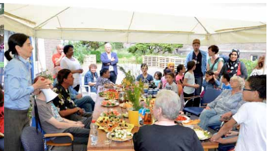
Tuinfeest in de 'verlengde huiskamer'